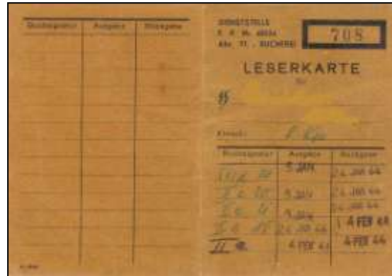
Lånekort til biblioteket i leiren i Sennheim

kaker, sjokoladeplate, drops, epler, og nokre sigarettar. Og ekstra god middagsmat i jule- og nyttårshelga. Julekvelden var det tilstelling av studentane og tale av SS- Obersturmführer Wilde. Nyttårskvelden heldt studentane revy, svært gildt. I går var det kino for oss i leiren her. Vi hadde juletre. I det heile ei ekstraordinær jul og eit uvanleg nyttår, på mange måtar svært interessant. Elles tenkjer eg så på korleis de har det heime. Snø kanskje, og fine skiturar, juletreffestar, selskap osv. Eg gleder meg svært til å høyre fra dykk. Med helsing, dykkar