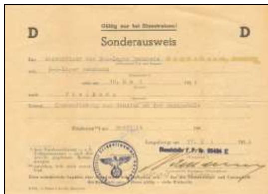
Beordring til universitetsstudier i Freiburg, 19. mai 1944

... I dag fikk vi for øvrig klarere linjer m.h.t. vår utdannelse, idet vi skulde få drive våre spesialstudier under fagfolk her i leiren, med professorer fra Strassburg og Freiburg, og hvis vi ikke er hjemme i april, dvs ved neste semesters begynnelse, skal det forsøkes å få oss inn på universiteter og høyskoler her i Tyskland. Når vi så er blitt ført fram til eksamen, skal vi her i Tyskland arbeide, hver av oss gjennom vårt fag, hele tiden forutsatt at vi i mellomtiden ikke er sendt hjem . .