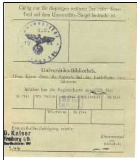
Legitimasjonskort, Universitetet i Freiburg