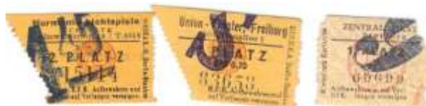
Billetter til Harmonie-Lichtspiele, Union-Theater og kino, Freiburg sommeren 1944